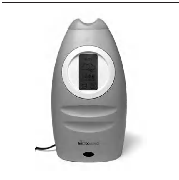
Fig. 1. Equipo de determinación de óxido nítrico en aire espirado NIOX-MINO® Aerocrine.

A cada voluntario se le realizaron en orden aleatorio la determinación de FE_{NO} con el sensor de quimioluminiscencia habitual N-6008® SIR, efectuando 3 determinaciones según método on-line 9 , y una sola determinación con el equipo NIOX-MINO®, según las instrucciones del fabricante. Todas las determinaciones se llevaron siempre a cabo en la misma franja horaria y 2 h después de la última ingesta alimentaria. Finalmente se realizó a todos los individuos una espirometría.